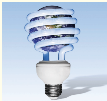
Sonne, Wind und Effizienz: die Oldenburger Energieforschung

Ölpreissteigerung, Klimawandel, Kriege um Ressourcen – Themen der Energieversorgung füllen zunehmend die Schlagzeilen. Energie ist mehr denn je ein Schlüsselthema auf der politischen Tagesordnung. Fragen der wirtschaftlichen Entwicklung, des Klima- und umweltschonenden Umgangs mit Ressourcen und von globaler Gerechtigkeit sind unmittelbar mit Art und Umfang der künftigen Bereitstellung von Energie verbunden. Ebenso stellt Energie einen wesentlichen Faktor für regionales Entwicklungspotenzial dar. Neue Strukturen, Prozesse und Technologien in der Energieversorgung und die zunehmende Nutzung erneuerbarer Energiequellen eröffnen Chancen für innovative Akteure, Standorte und Regionen.